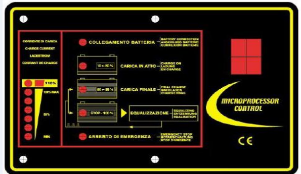
PEL (램프 충전기)